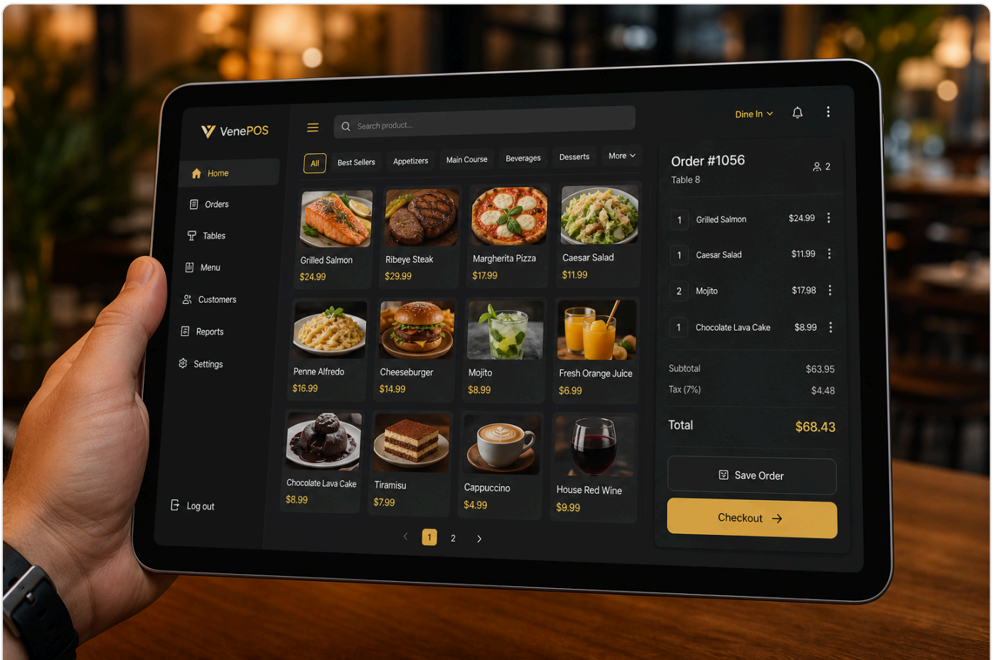
Tablet mesero — pedidos por WiFi