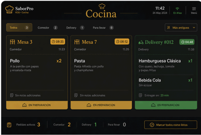
Cocina — cola de preparación